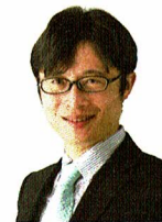
NPO法人となりのかいこ 代表理事

大阪大学人間科学部卒業。株式会社パソナフォスター、老人保健施設、認知症グループホームを経て、2008年グレースケアを設立。長時間・泊まりケア、娯楽ケア、医療的ケアなど自費を中心に、介護保険や障がい福祉、民家デイ、ケア付シェアハウスなどに取り組む。